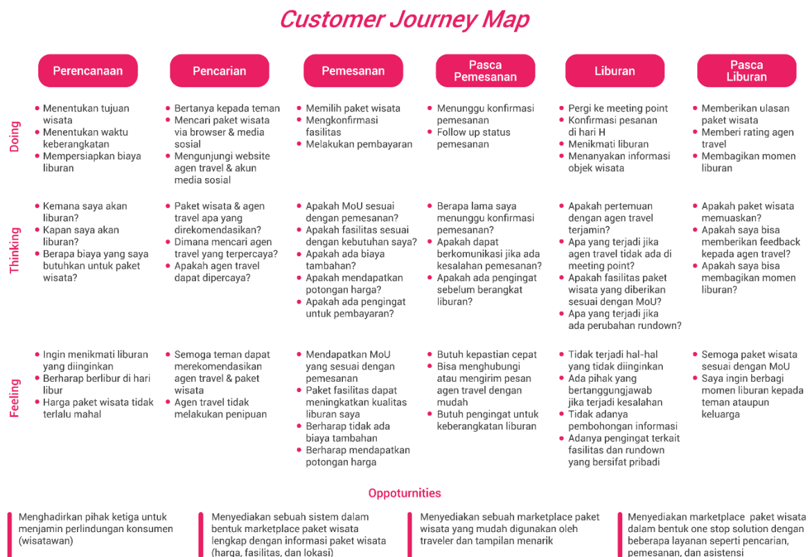
Gambar 1 Customer journey map kegiatan liburan wisatawan lokal