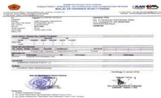
Gambar 1. Hasil Pemeriksaan Jembrana Balai Veteriner Bukittinggi

Berdasarkan Pedoman Pengendalian dan Penanggulangan Penyakit Jembrana (2015), tanda-tanda klinis penyakit jembrana adalah demam tinggi, kebengkakan kelenjar limfe dan mencret